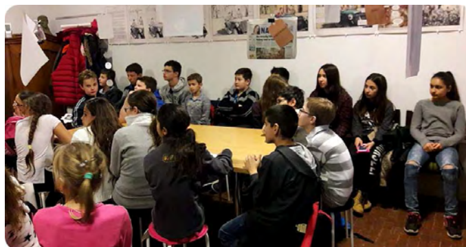
A Debreceni Irodalom Házában

Iskolánk 40 tanulója 4 kísérővel vett részt november 13-án a magyar nyelv napja alkalmából szervezett programokon Debrecenben.