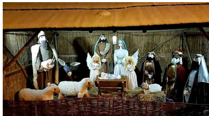
Betlehemes kép a templomkertben