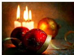
Menyhárt Károly polgármester

A település érdekében eddig nyújtott segítségét a Városháza nevében ezúton köszönjük és mindenkinek Békés Karácsonyi Ünnepeket és Boldog Új Évet kívánunk!