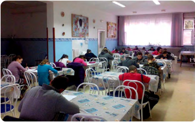
A verseny egy pillanata

Sajnos az SNI Tehetségeket Segítő Tanács az idei tanévben nem tudta megrendezni az országos szépíró versenyt. Iskolánk ennek ellenére úgy döntött, hogy intézményi kereteken belül megszervezi a sajátos nevelési igényű és beilleszkedési, tanulási, magatartási zavarral küzdő tanulóink számára a kézírás fontosságát hangsúlyozó megmérettetést.